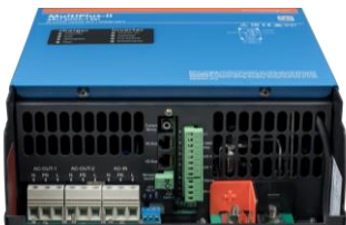
Área de conexión MultiPlus-II 3k